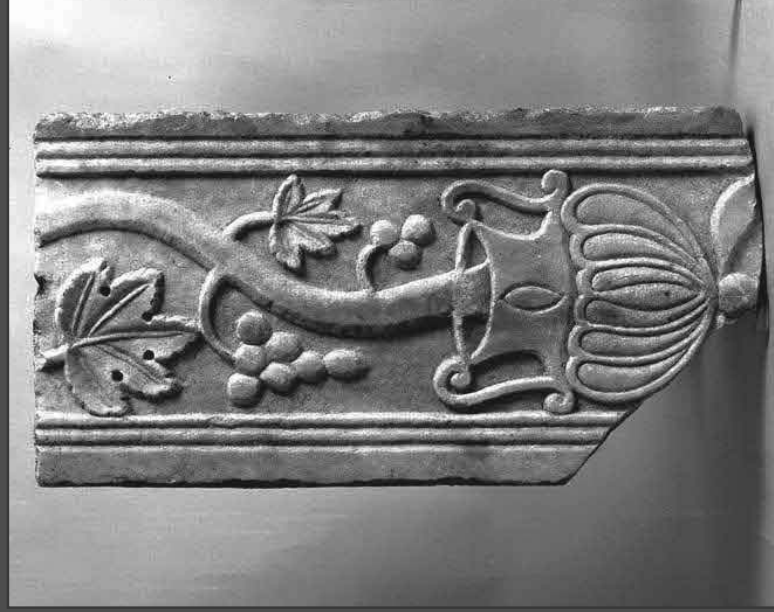
Zgodnjekršćanska reliefna stenska obloga, najdena v bližini Apolovega templja. Podoba vinske trte (In 15,1-17) prikazuje temeljno povezanost Kristusa in Cerkev; Cerkev, ta skupnost življenja z Njim in za druge, je ustanovljena po krstu in se poglavlja z vsako evharistijo (Joseph Ratzinger).

11-15 Pavel se zaveda napetosti med tradicionalnim gledanjem na ženske in novo enakostjo vseh v Kristusu, zato v teh vrsticah znova poudari enakovrednost in medsebojno odvisnost moškega in ženske (prim. Ef 5,21sl.). Že kot »naravna človeka« sta poklicana živeti v odnosu drug z drugim, ne pa v prepiru in osami. Po Gospodovem klicu so verniki poklicani v občestvo z njim ( koinōnia ), medsebojni soodvisnosti moškega in ženske in zakonskemu odnosu pa daje ta krščanska poklicanost še novo kristološko in ekleziološko razsežnost. Vse končno izhaja od Boga in je njemu podvrženo.